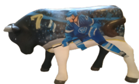
Jungstier im Zuger Design